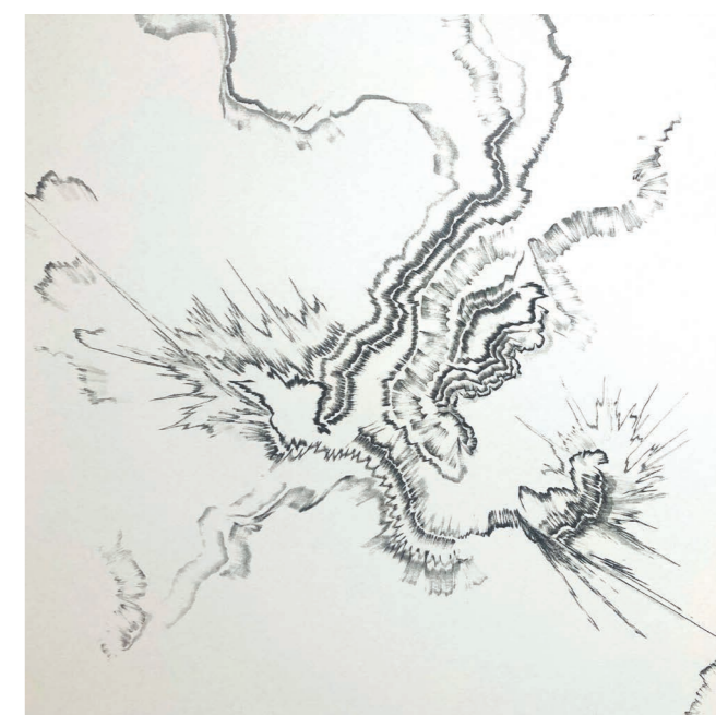
„Scar“ (Detailansicht), 2022, Graphit auf Papier, ca. 57 x 78 cm