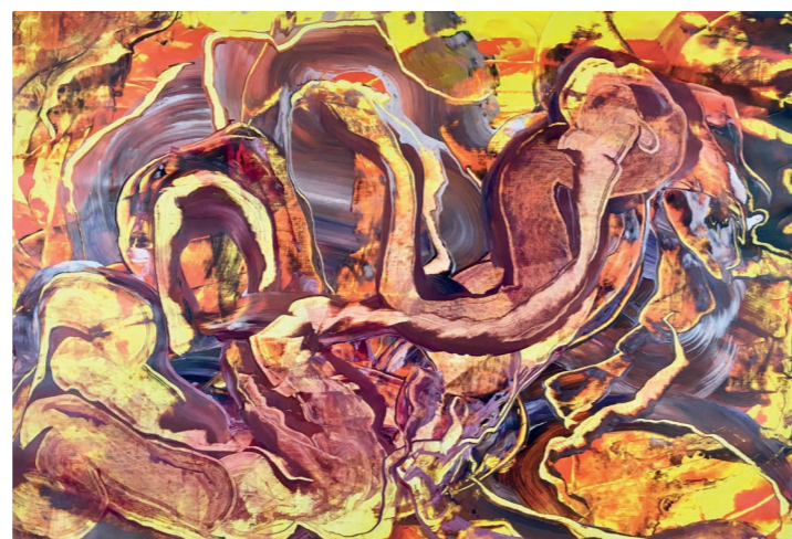
„TransZOO“ (Studie), 2017, Acryl auf Papier, 60 x 85 cm