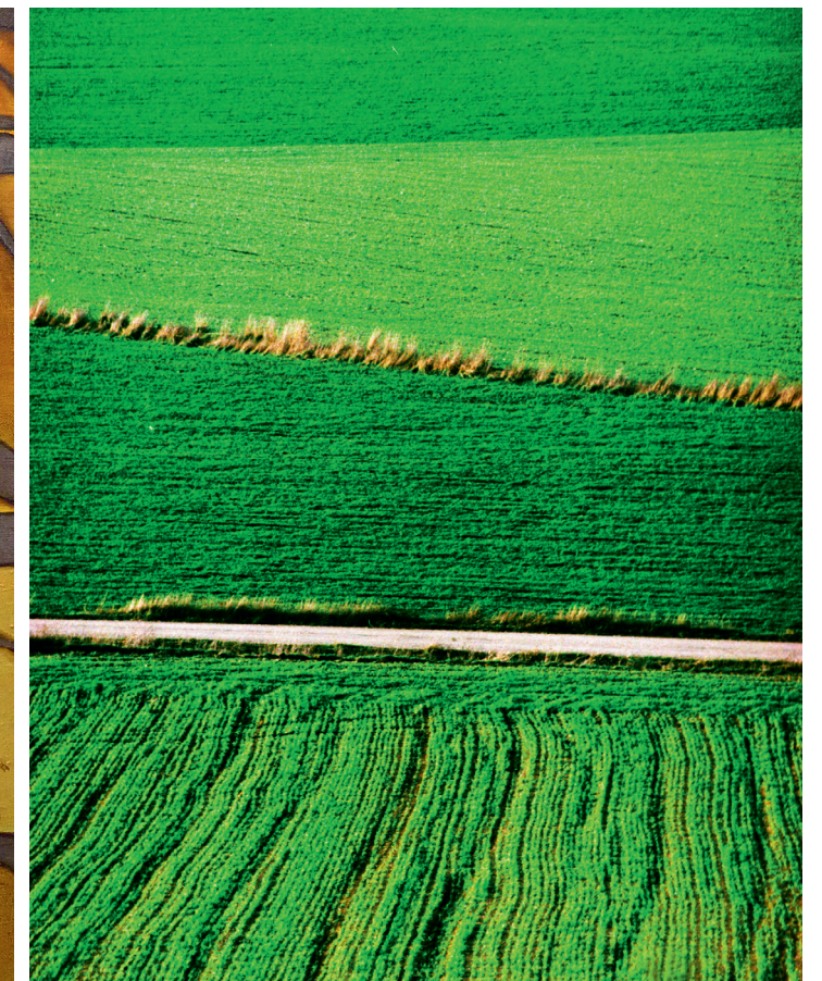
Textura Castellana, 2002, Fotografie, Digitaldruck auf Alu-Dibond, 70 x 50 cm