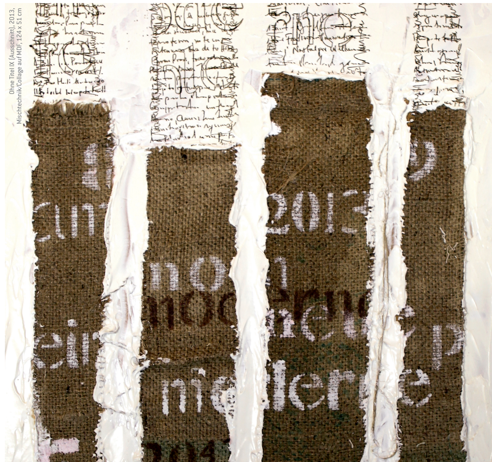
Ohne Titel IX (Ausschnitt), 2013, Mischtechnik/Collage auf MDF, 124 x 51 cm

REDAKTION: Kulturbüro Dr. Irmtraud Rippele-Mann Oldenburg GESTALTUNG: www.schwanke-raasch.de