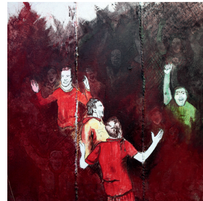
„o.T.“, 2013, Mischtechnik auf Jute, 200 x 180 cm