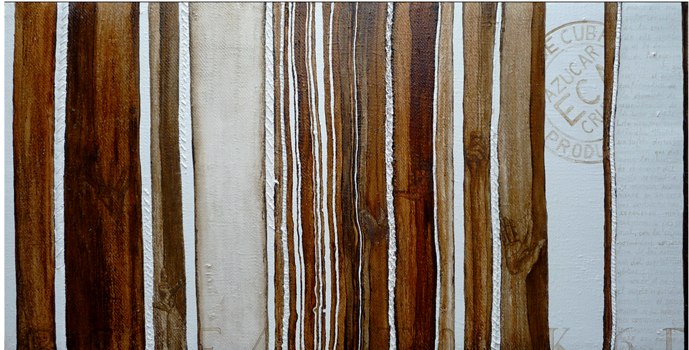
„Verwandlung II“, 2010, Mischtechnik auf Jute, 200 x 100 cm