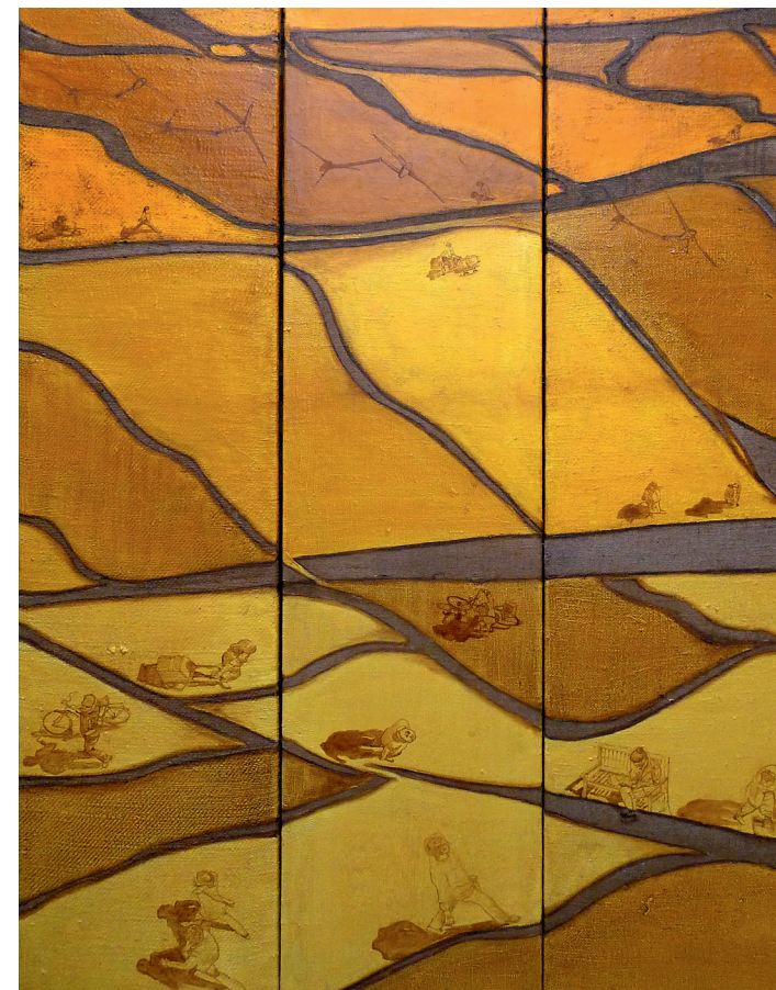
„Blick nach draußen“, Triptychon, 2011, Öl auf Jute, 200 x 150 cm