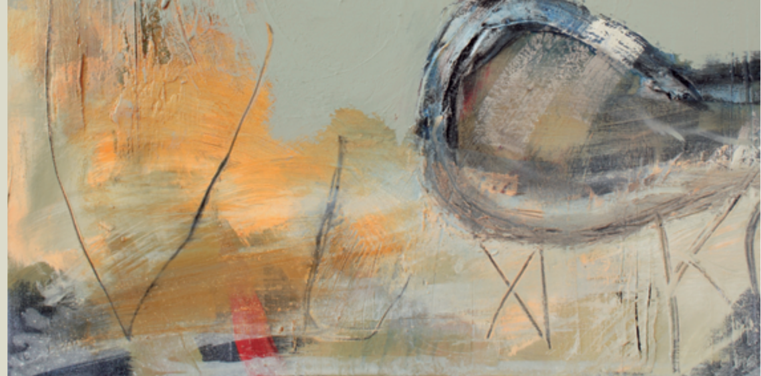
„Vlixko II“, Acryl auf Leinwand, 2005, 70 x 70 cm