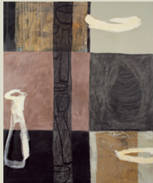
„Agar 68“, Acryl auf Leinwand, 2006, 50 x 180 cm