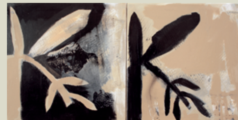
„Mgomba“, Acryl auf Leinwand, 2005, 10-tlg., je 30 x 30 cm