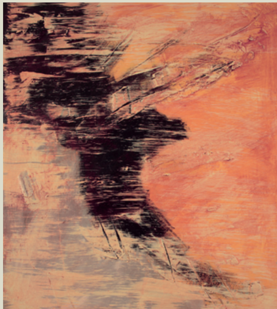
„Ta`amia II“, Acryl auf Leinwand, 2006, 80 x 120 cm