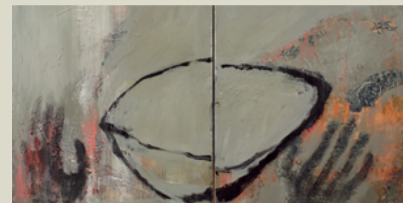
„Dareda“, Acryl auf Leinwand, 2005, 2-tlg., je 70 x 70 cm